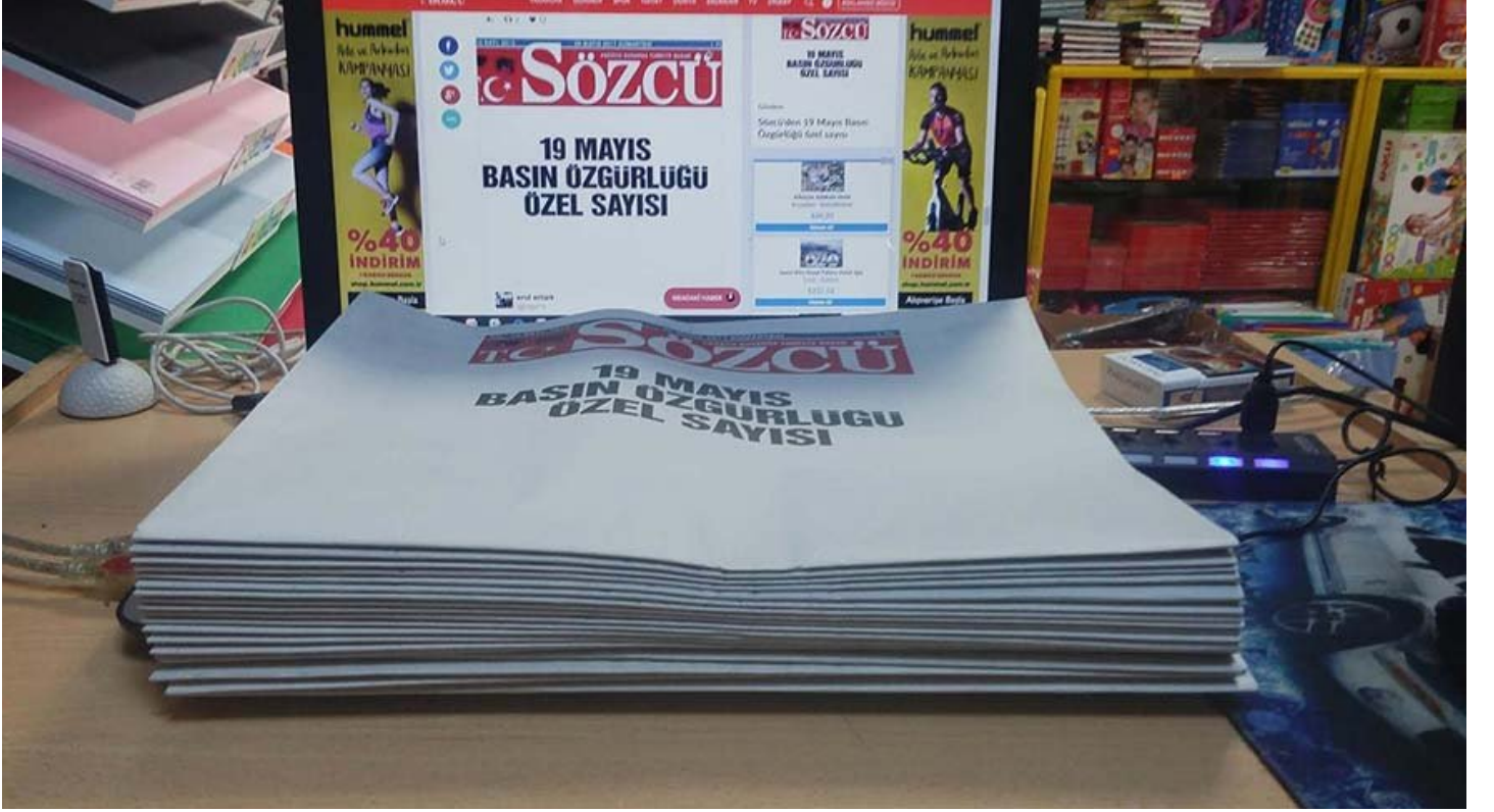
20 Mayıs 2017'de SÖZCÜ Gazetesi böyle çıkmıştı.

Topluma ve tarihe karşı sorumlu olmak... Slogan düzeyinde kalmaması gereken kocaman sözler!