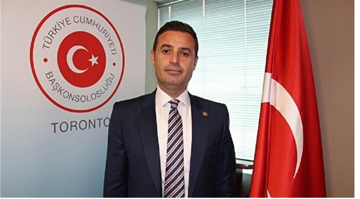
CHP Balıkesir Milletvekili Ahmet Akın