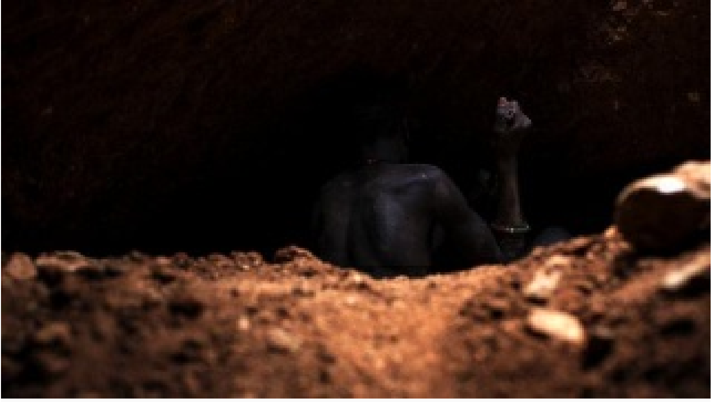
Altın madeni çöktü: 18 ölü