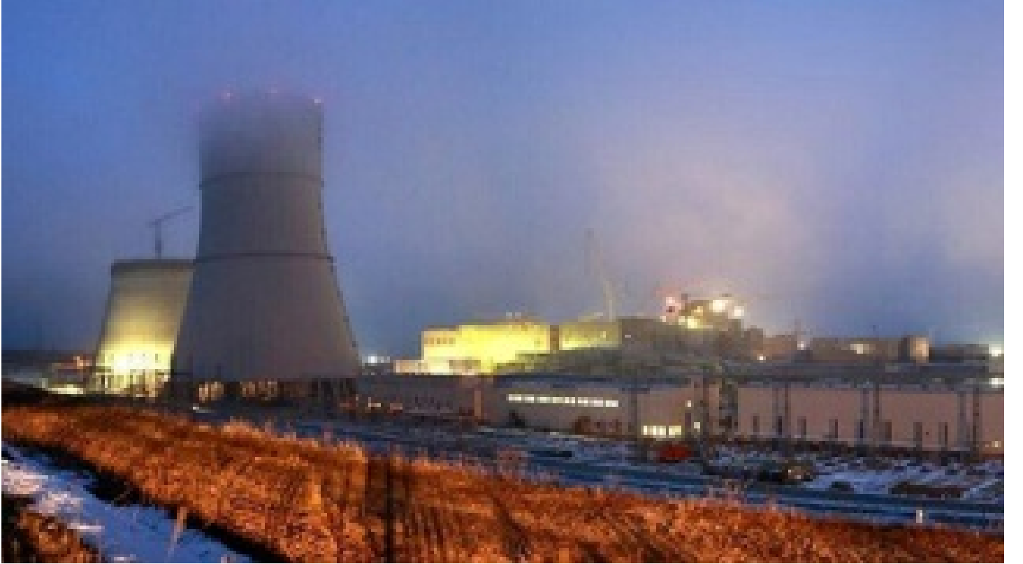
Nükleer santraldaki yangın kontrol altına alındı