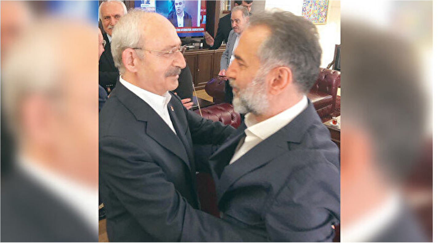
Kemal Kılıçdaroğlu ve Rasim Bölücek