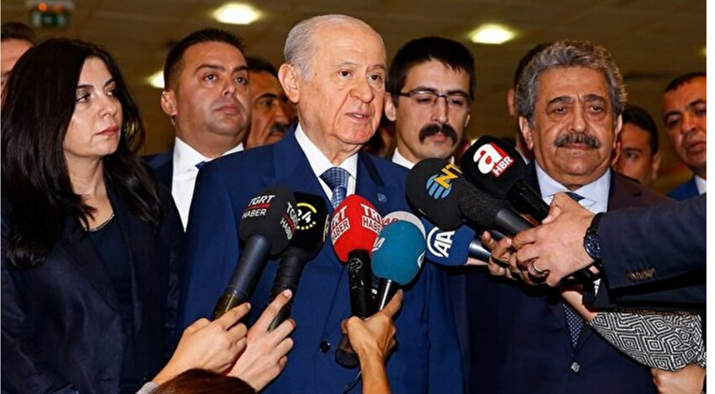
MHP Genel Başkanı Devlet Bahçeli

Haber Merkezi · 03 Mayıs 2018, 10:21 · Son Güncelleme: 03 Mayıs 2018, 11:30 · Tvnet