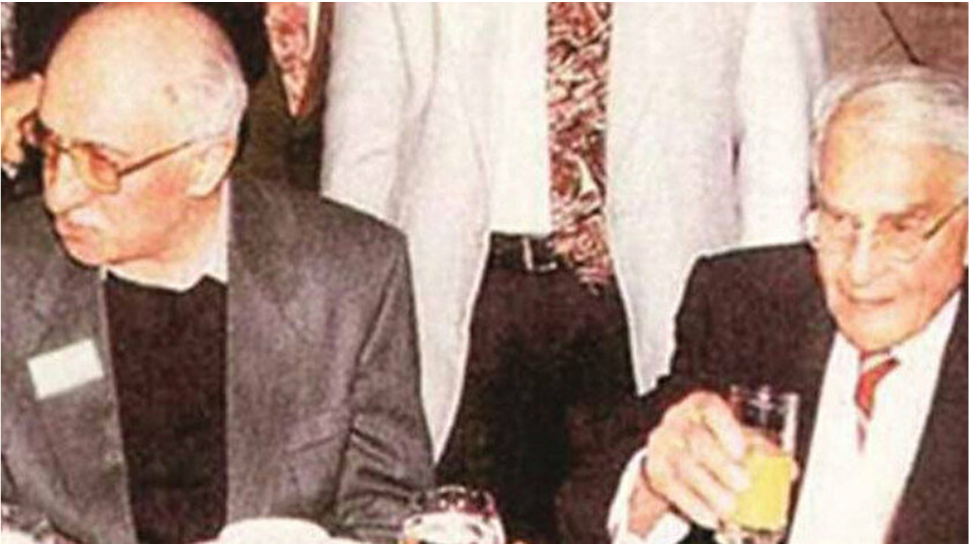
Teröristbaşı Gülen (sol) Kasım Gülek (sağ)