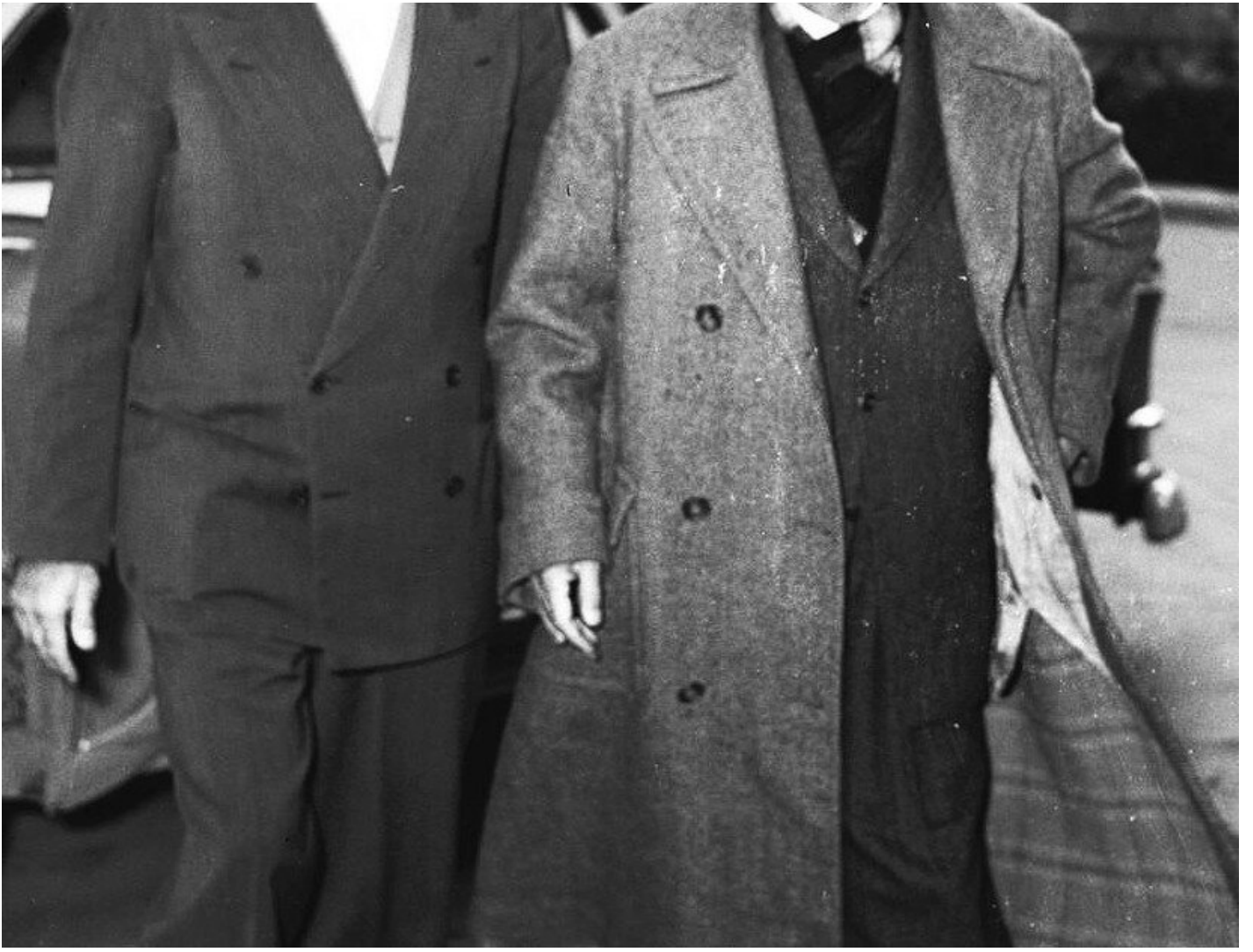
İsmet İnönü (Sağ)

Milli Birlik Komitesi'ne gönderilen 2 raporda da İsmet İnönü'nün korunması dikkat çekti. Gerçek Hayat'ın yayınladığı belgelere göre dönemin ünlü masonlarının ismi tek tek sıralanırken 1937 yılında "İstiklal-Areopage" adlı locaya kayıt yaptıran İnönü'nün adına yer verilmedi.