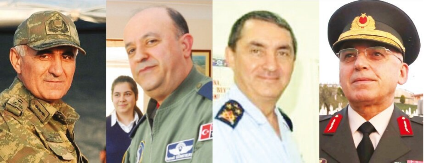
Osman Erbaş-İsmail Güneykaya-Hasan Küçükakyüz-Musa Avseven

Kara Kuvvetleri Kurmay Başkanlığı, 2. Ordu Komutanlığı ve Kara Kuvvetleri EDOK Komutanlığı rütbeleri korgeneral seviyesine düşürüldü. Orgeneralliğe terfi eden isim, 2. Kolordu Komutanı Musa Avsever oldu. Avsever, darbe gecesi "Milletimizin yanındayız. Bu belayı hep birlikte defedeceğiz. Kolordumuz milletimizin yanında görevinin başındadır" açıklamasıyla darbecilerin karşısında durmuştu. Hava Kuvvetlerinde de Hava Eğitim Komutanı Korgeneral Hasan Küçükakyüz orgeneralliğe terfi eden isim oldu. Org. Küçükakyüz, YAŞ'ta yerine atandığı Muharip Hava Kuvvetleri Komutanı Korgeneral Mehmet Şanver'in kızının düğününden, Hava Kuvvetleri Komutanı Orgeneral Abidin Ünal ile birlikte rehin alınan generaller arasındaydı. Küçükakyüz'ün İzmir Çiğli'de konuştuğu 2. Ana Jet Üs Komutanlığı'nda 27 Mayıs'ta bir suikast girişiminden son anda kurtulduğu ortaya çıkmıştı. Helikopter düşürerek suikast girişimi teşebbüsü, bir astsubayın dikkati sonucu önlenmiş, helikopterin arızası kayıtlara da girmemişti.