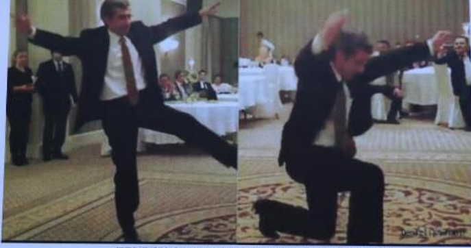
ZEYBEK OYUNUNU MUHTEŞEM OYNARKEN...

07.11.2017 - 19:27 || Son Güncelleme : 07.11.2017 - 19:27