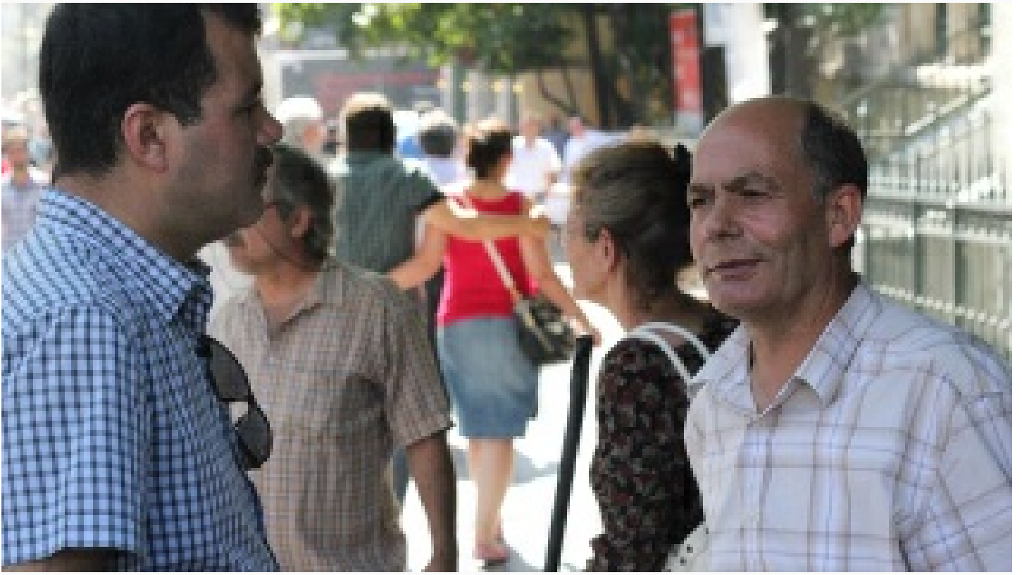
İliğine işlemiş cesaret erdemi... Onun için zor değil olağandı