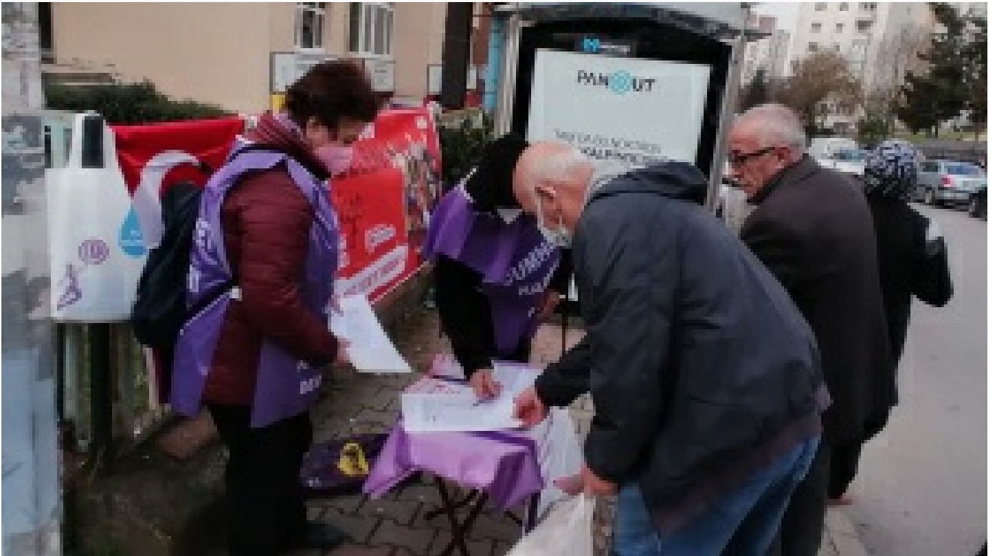
6 Mart'ta Tandoğan'da buluşuyoruz! Üretici kadınlar en önde