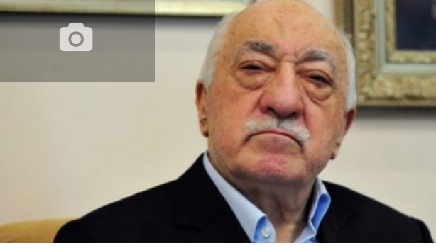
FETÖ talimatı verdi: Yatırımı engelleysin