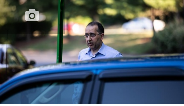
Özal'ı son gören FETÖ'cü kaçak doktor ABD'de ortaya çıktı