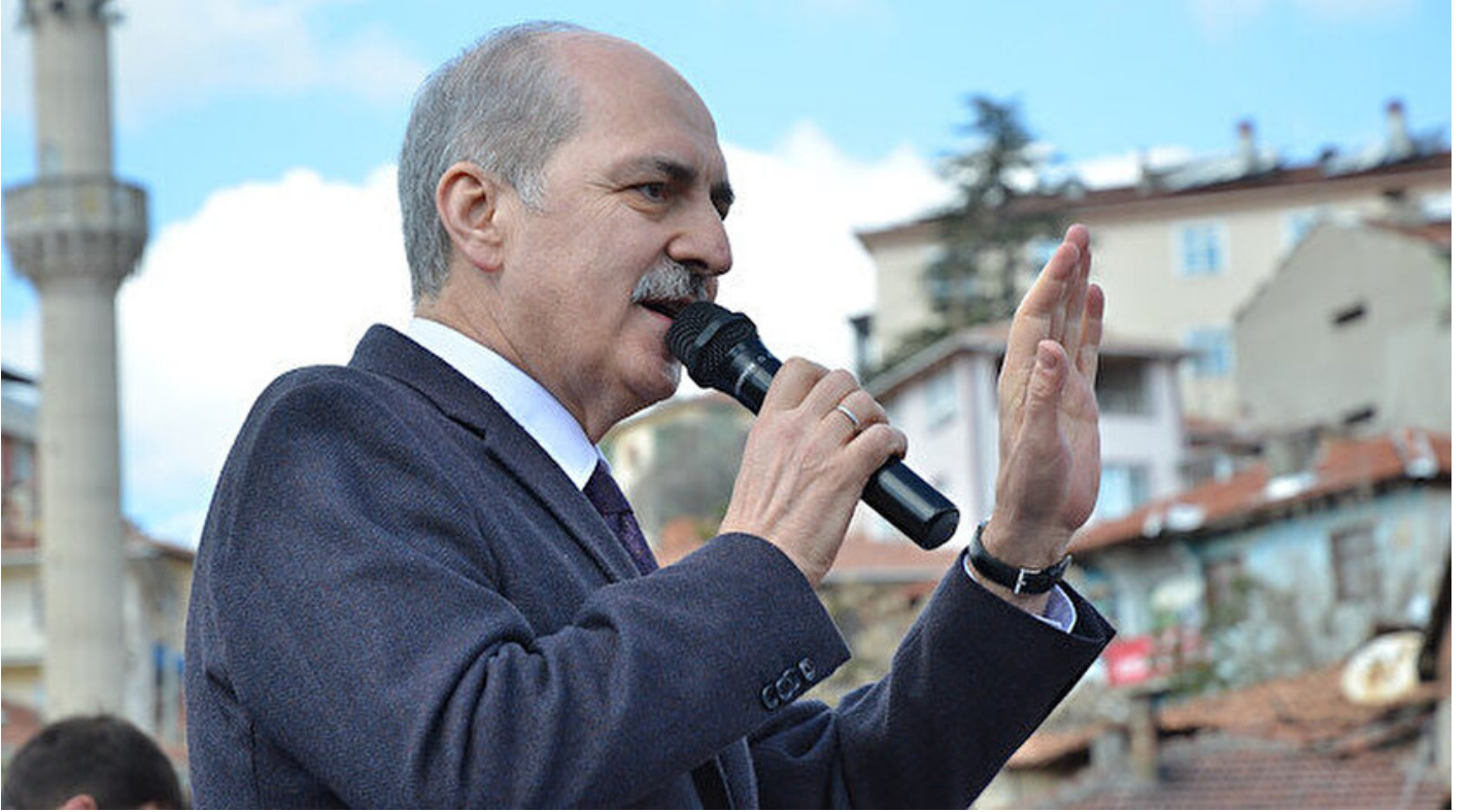
AK Parti Genel Başkan Vekili Numan Kurtulmuş

Haber Merkezi · 07 Mart 2019, 20:37 · Son Güncelleme: 07 Mart 2019, 20:41 · AA