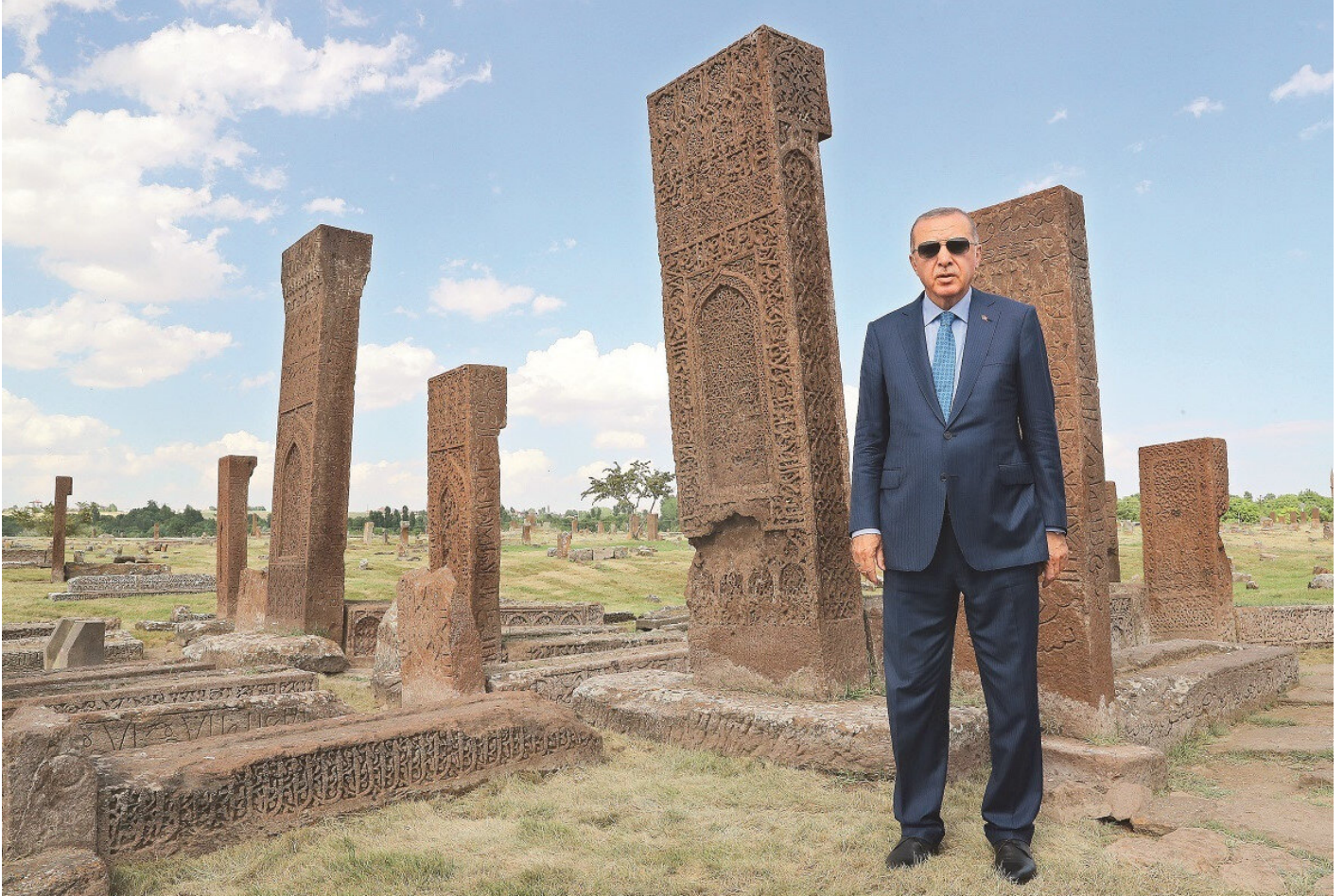
Erdoğan, Bitlis'te Ahlat Selçuklu Mezarlığı'nı ziyaret etti.