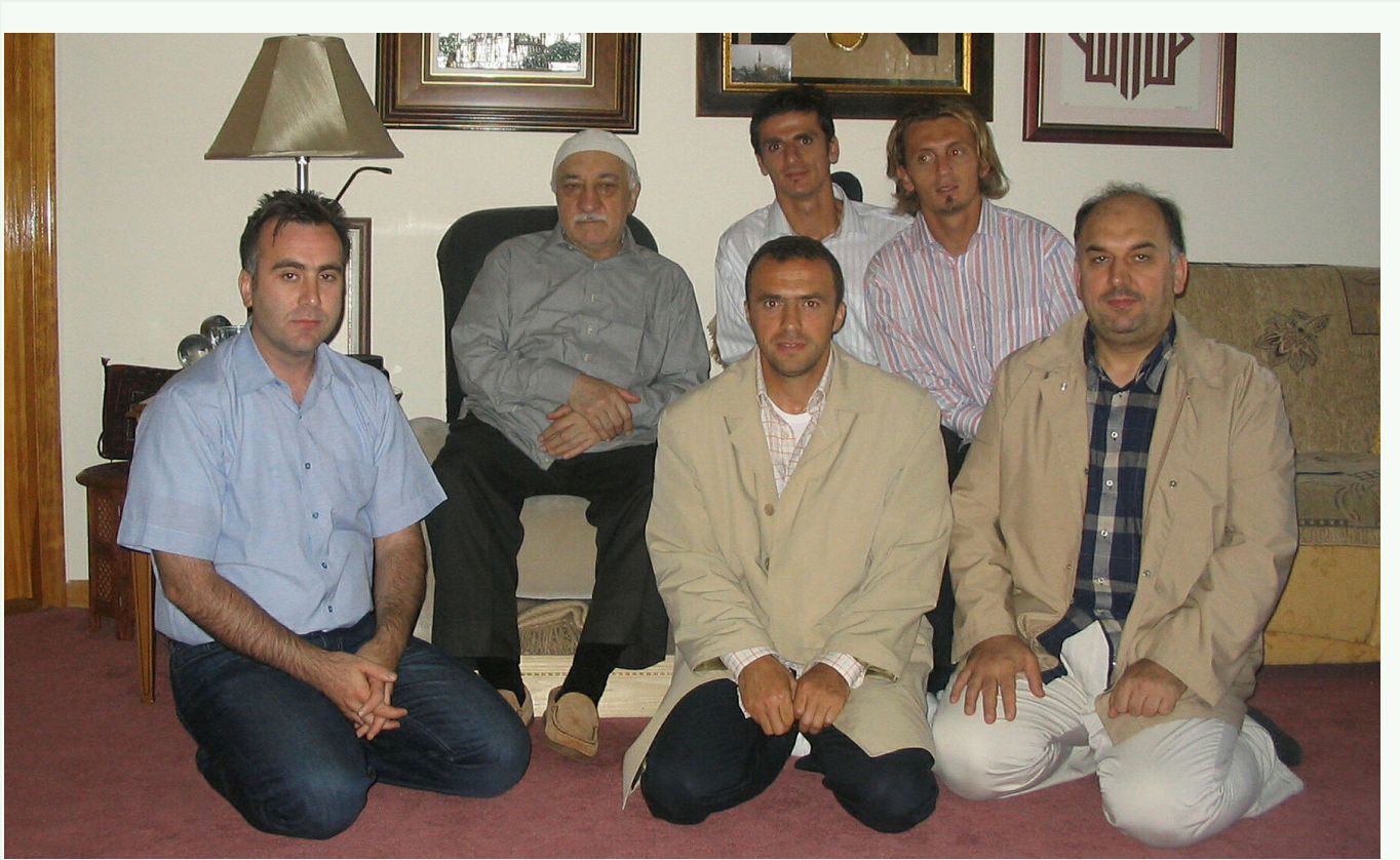
FETÖ Elebaşı ve dizinin dibinde oturan örgüt mensubu eski futbolcular. 15 Temmuz sonrasında ortaya çıkan bilgi ve belgelere göre bu futbolcuların örgütün spor yapılanmasında çok önemli görevler üstlendiği, takımların ilk 11'inden Milli Takım'a seçilecek futbolcuların kim olacağına dahi karar verebilecek güce ulaştıkları ortaya çıkmıştı.

1983-1984 yılından itibaren futbola 'yakın markaj' uygulayan örgütün bu dönemde çok sayıda futbolcuyla kendi saflarına kattığı, takımda ilk 11'de yer alacak isimlerden transfer listelerine, kulüp başkanlarının yönetime alacağı işadamlarından, Milli Takım'da dahi yardımcı antrenörün kim olacağına kadar çok geniş bir alanda etkisinin hissedildiği istihbarat raporlarına yansdı.