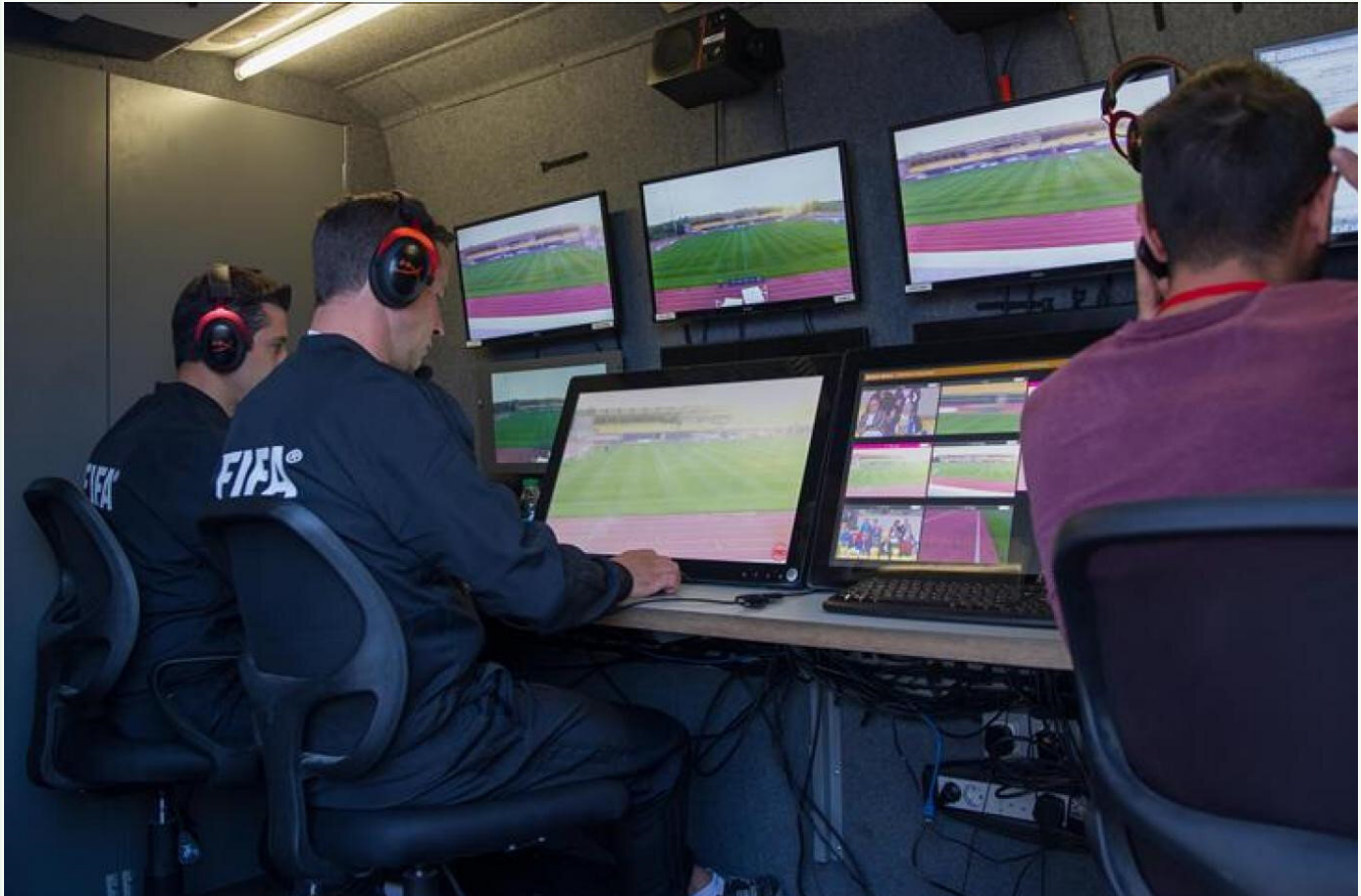
VAR sisteminin gelmesiyle birlikte ihtiyaç duyulan hake sayısı daha da arttı. Ancak TFF ihtiyacı alttan gelen

Bilindiğı üzere hakemler aldıkları göreve göre maç başı olarak ücretlerini alıyorlar. Geçtiğimiz sezon Türkiye'de VAR sisteminin gelmesiyle birlikte hakemlerin omuzlarında yük ve dolayısıyla ihtiyaç duyulan hake sayısı arttı. Ancak son yıllarda alttan yetişen yeni bir hake olmadığı gibi, örneğın bir maçta orta hake olarak görev yapan ismin ertesi gün VAR hakemi olması gibi garabetlerin yaşanması 'Hakemler sürekli neden aynı havuzdan kullanılıyor' sorusunu da beraberinde getirdi.