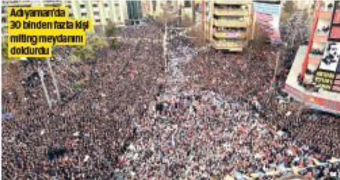
Adıyaman'da 30 binden fazla kişi miting meydanını doldurdu

Herkes patirpatir ayrılacak. Devleti güle güle bırakmaya istemediğini belirterek, "Ancak samimi olmayınca yakayı ele verdiler. Gülen'in Hummeyni gibi dönme hesabı vardı. Şemada kainat imamı diye geçiyor" dedi.