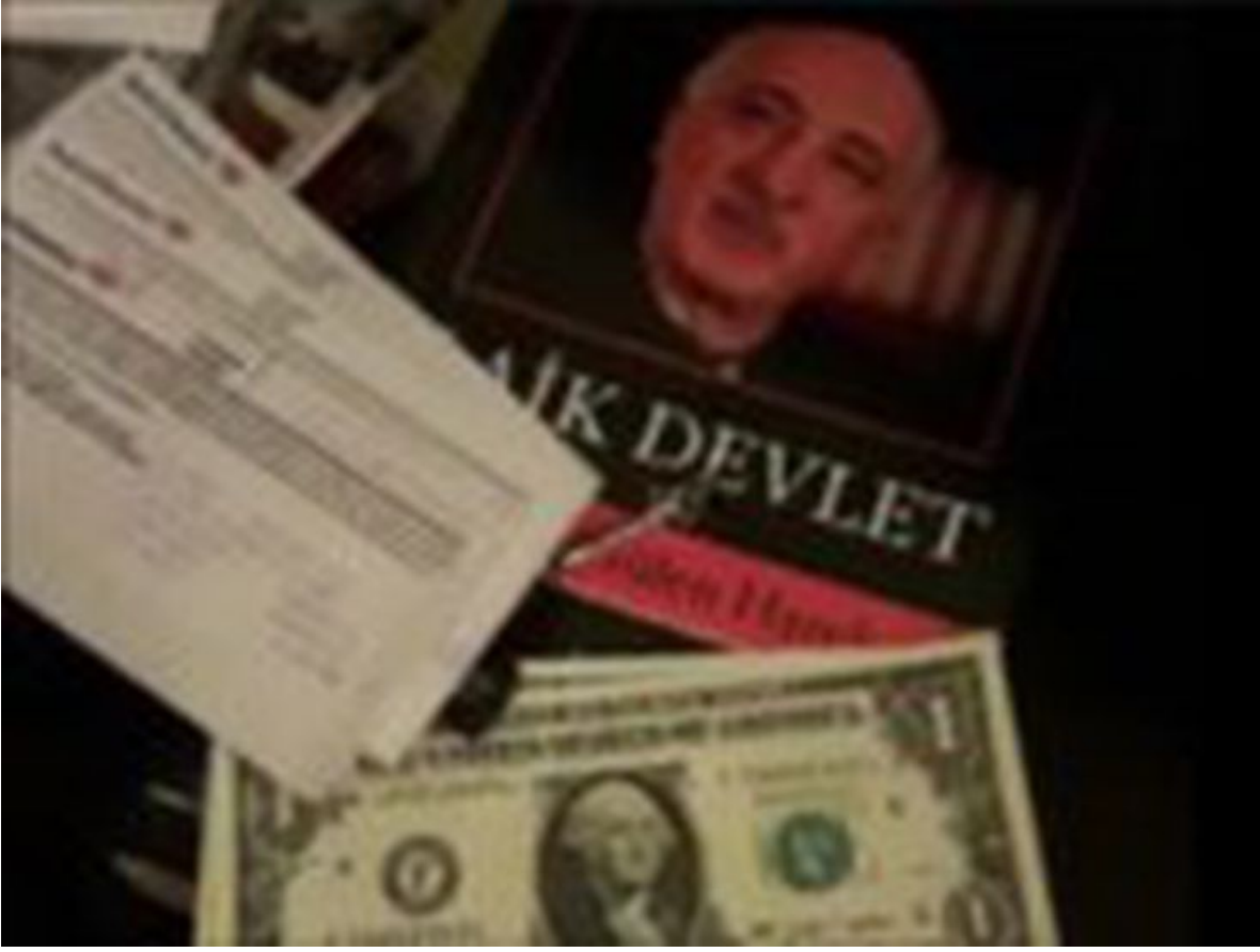
O akademisyenlerin odasından da dolar çıktı

FETÖ'cülerin üzerlerinde ve evlerinde bulunan bu banknotlar, akıllara Kurtlar Vadisi Pusu'da 2 yıl önce yayınlanan 202. bölümdeki 1 dolar sahnesini getirdi.