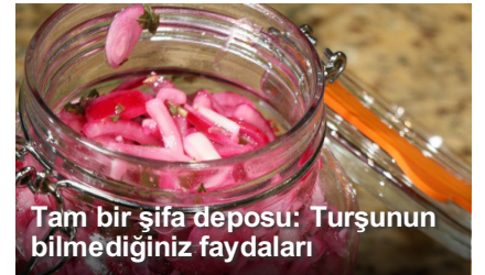
Tam bir şifa deposu: Turşunun bilmediğiniz faydaları