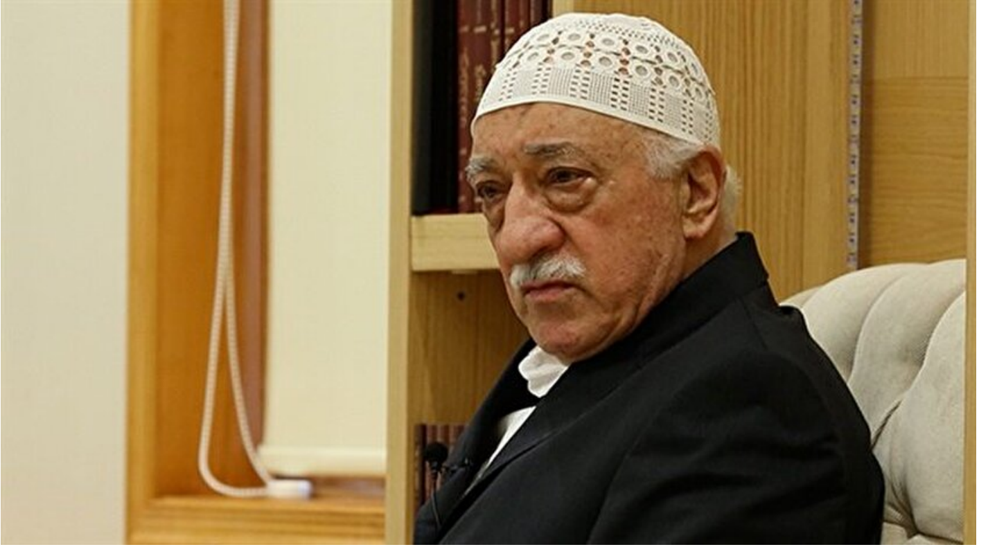
FETÖ elebaşı Fetullah Gülen

Haber Merkezi · 26 Ekim 2016, 09:46 · Son Güncelleme: 26 Ekim 2016, 13:37 · Diğer