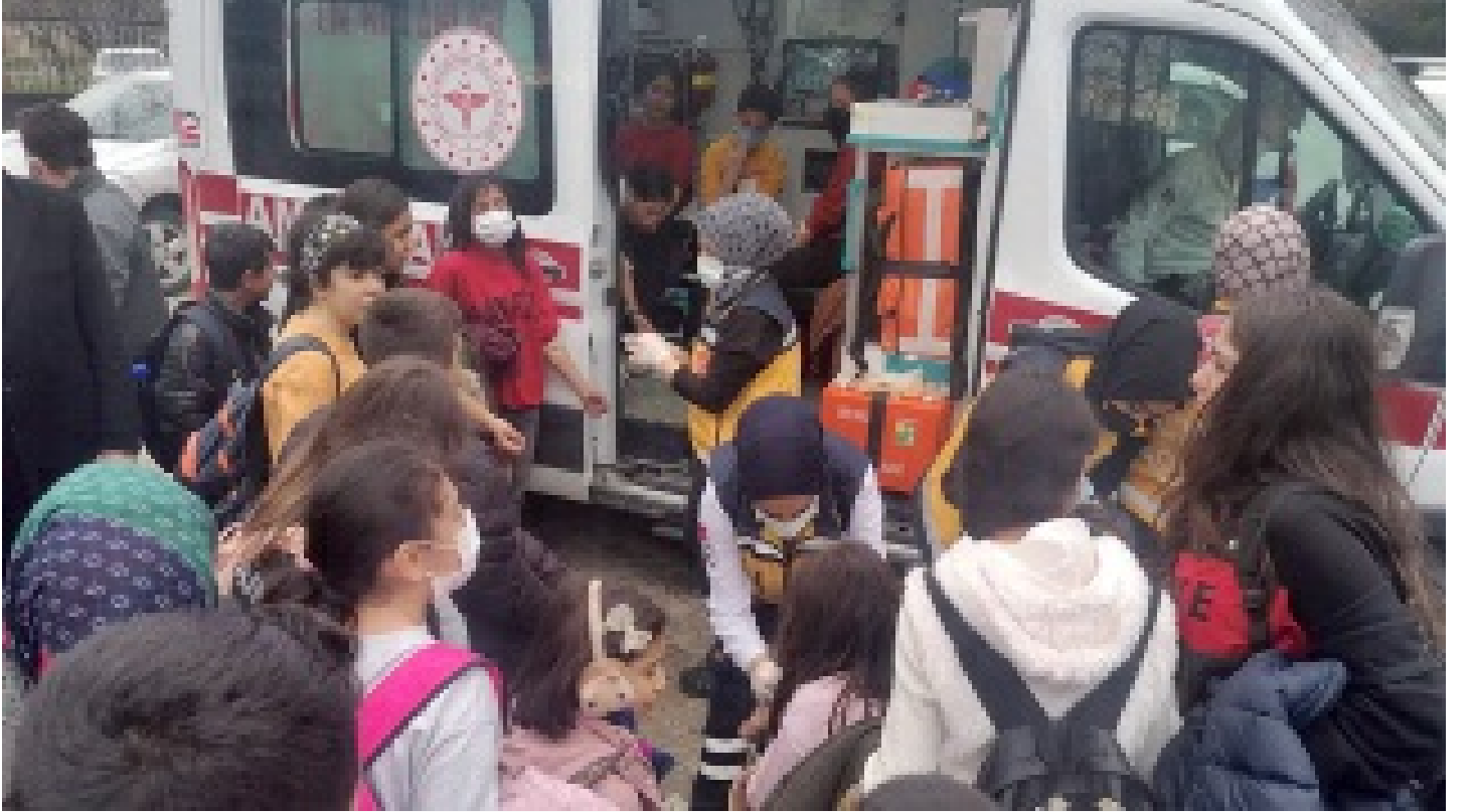
70 öğrenci hastaneye kaldırıldı