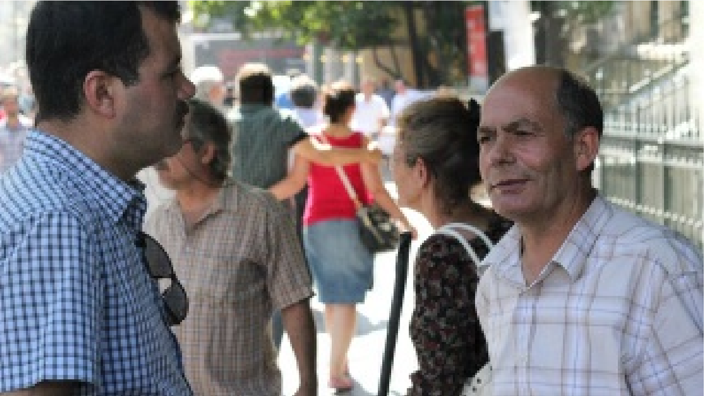
İliğine işlemiş cesaret erdemi... Onun için zor değil olağandı