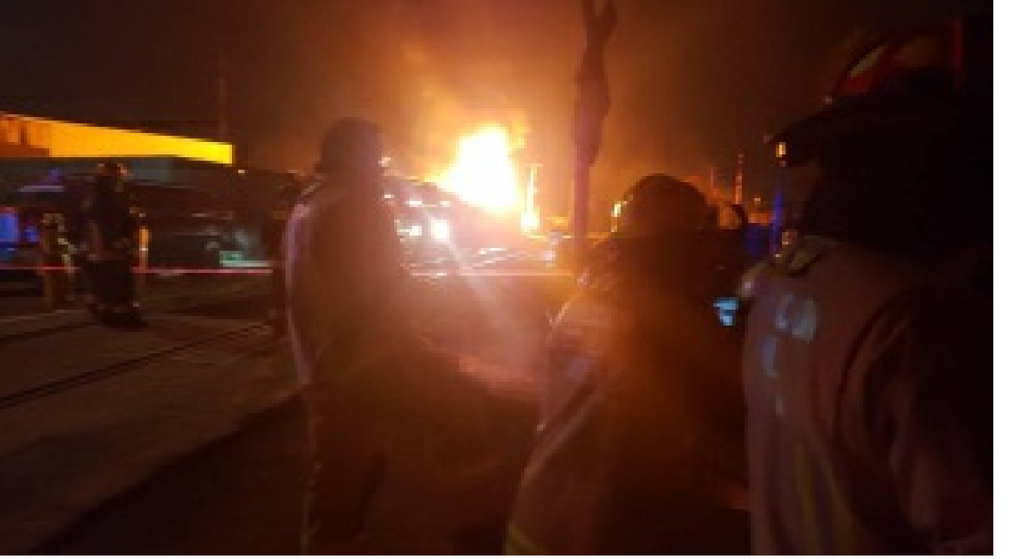
Dolmabahçe Sarayı'nda yangın!