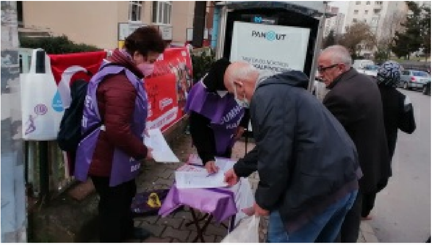
6 Mart'ta Tandoğan'da buluşuyoruz! Üretici kadınlar en önde