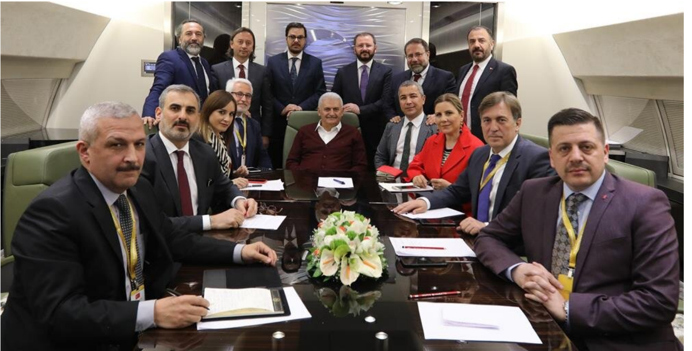
Başbakan Yıldırım, İspanya dönüşünde gazetecilerin sorularını yanıtladı.

Arkadaşlar, seçim takvimi belli oldu. Seçim havasına girilince tabii trafik yoğunluğu artar. Herkes, ben de buradayım, beni de unutmayın mesajını veriyor. Bunu yadırgamamak lazım. Seçim öncesi bu tip şeyler olabilir. Başka partilerin ne yaptığını, ne ettiğini biz üzerinde durmanın çok gerekli olmadığını düşünüyoruz. Biz kendi işimize bakalım. Biz seçime en iyi şekilde hazırlanacağız.