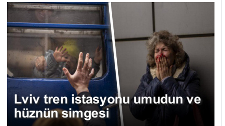
Lviv tren istasyonu umudun ve hüznün simgesi