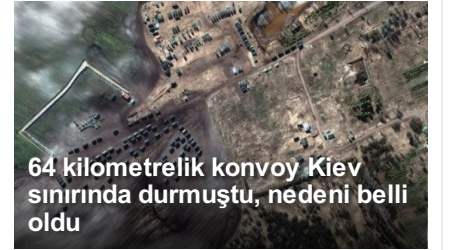
64 kilometrelik konvoy Kiev sınırında durmuştu, nedeni belli oldu