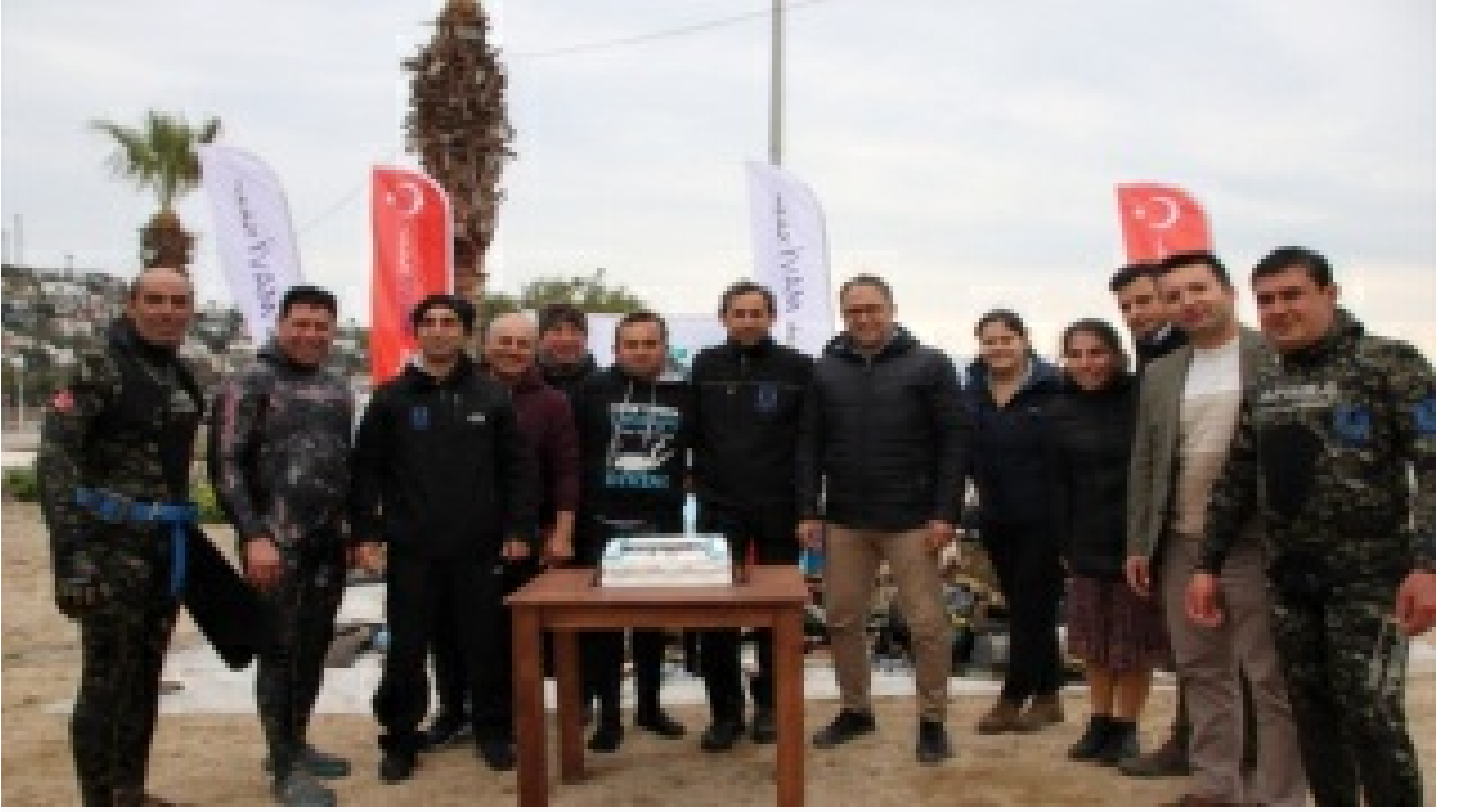
Dalgıçlar denizi, öğrenciler kıyıyı temizledi