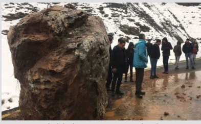
Mahalleliyi iki gündür tedirgin eden olay