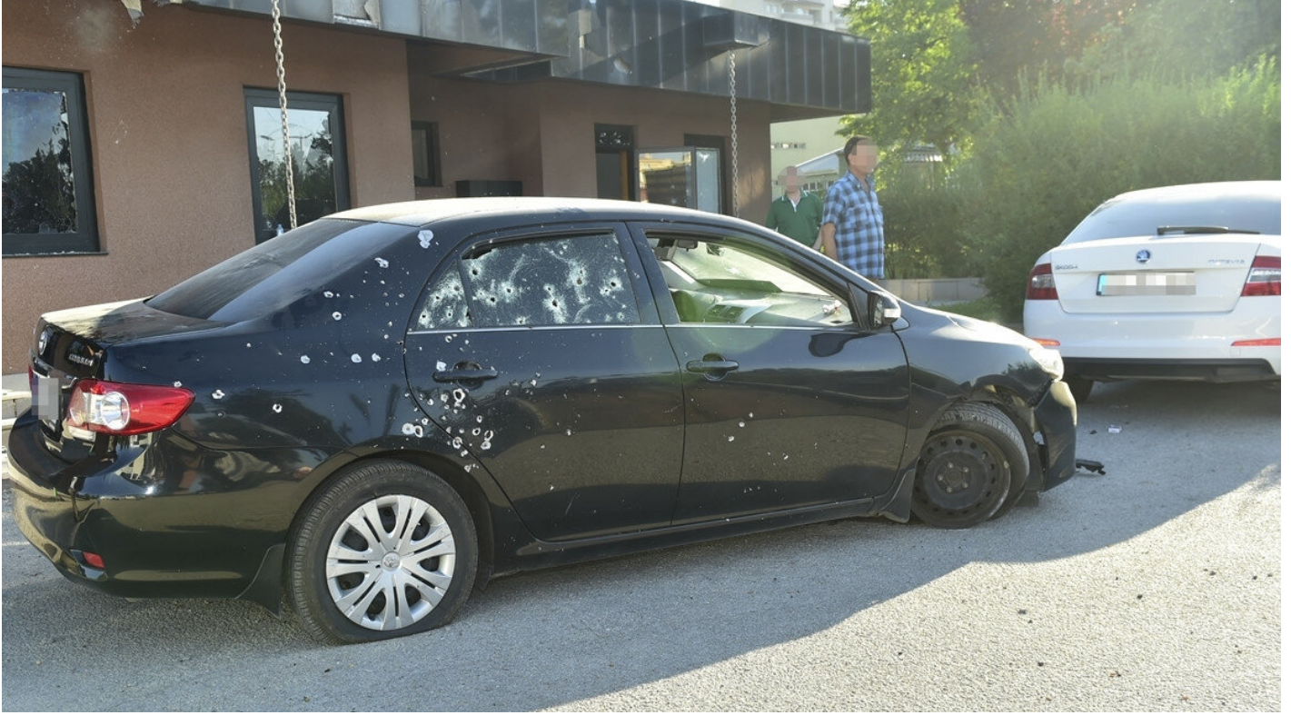
15 Temmuz'da FETÖ'cü hainlerin saldırdığı MİT içerisinde yer alan bir araç.

Bu doğrultuda ihbarlardan 6 bini işleme alınarak ilgili güvenlik birimleriyle paylaşıldı ve operasyona dönüştürüldü. Bu sayede, FETÖ/PDY içindeki kripto bazı isimler tespit edilerek haklarında adli süreç başlatılırken PKK ve DEAŞ'ın yurt içi ve yurt dışındaki yapılanmalarına ağır darbeler indirildi.