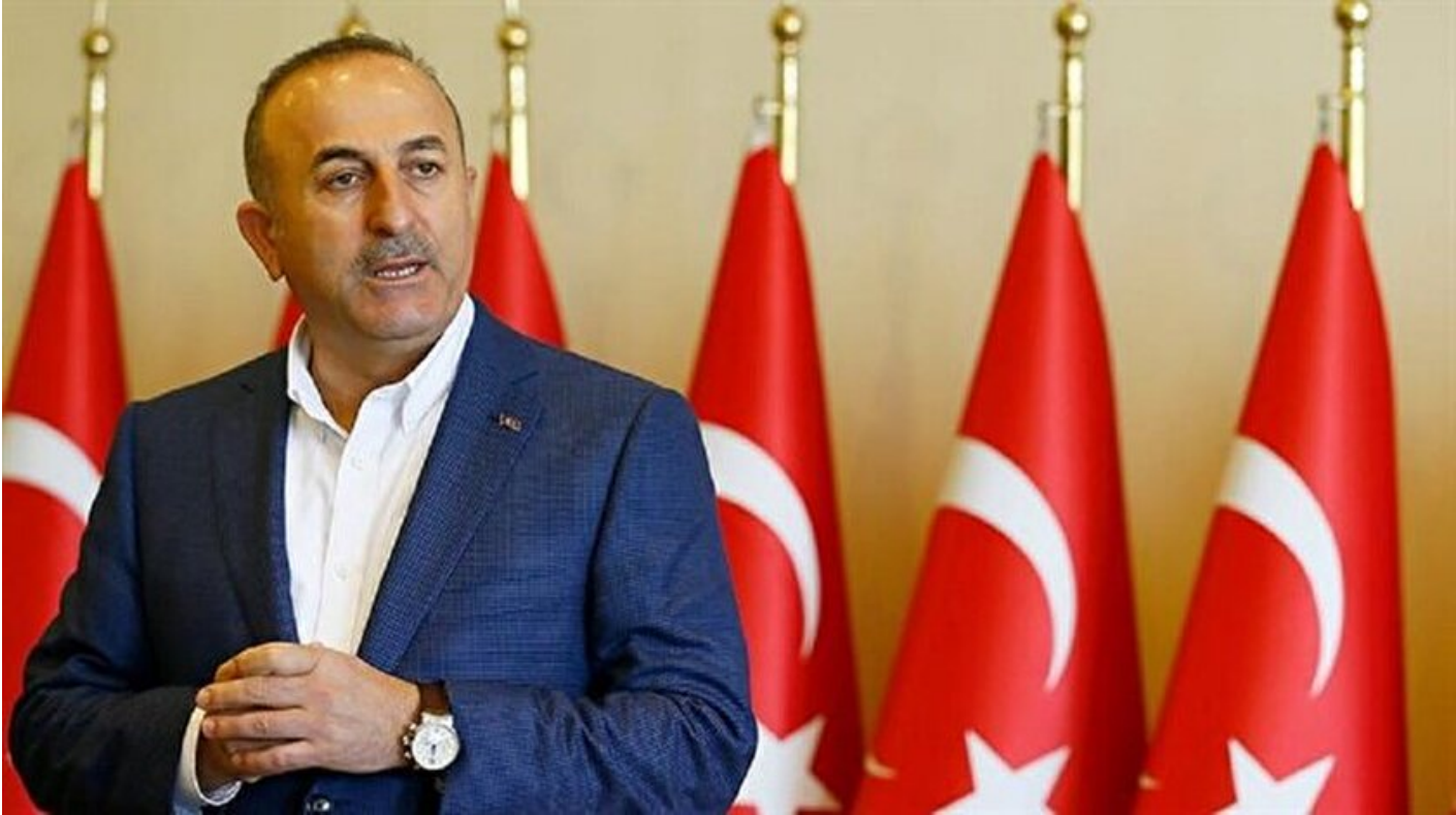
Dışışleri Bakanı Mevlüt Çavuşođlu

Haber Merkezi · 11 Haziran 2018, 21:05 · Son Güncelleme: 11 Haziran 2018, 21:18 ·