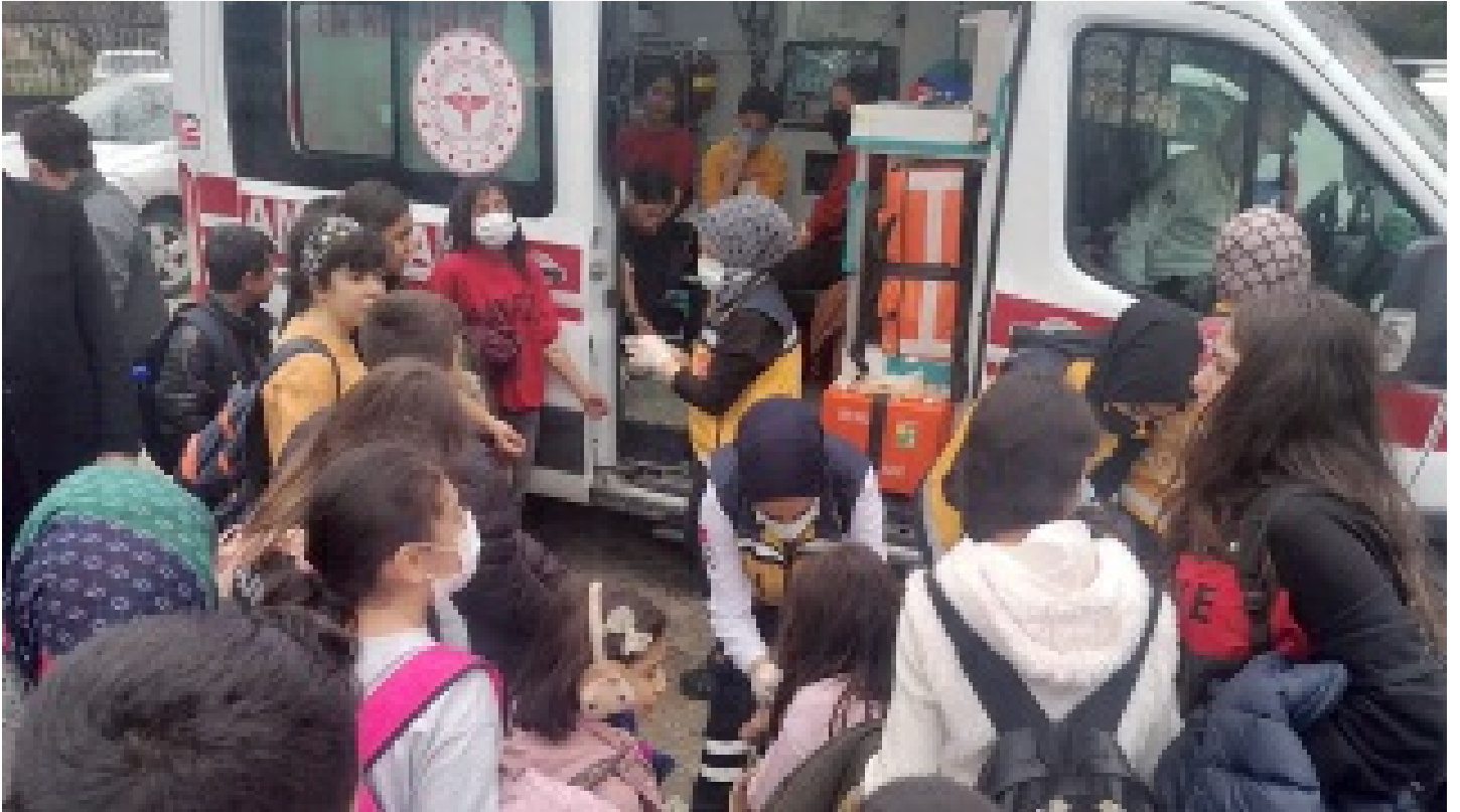
70 öğrenci hastaneye kaldırıldı