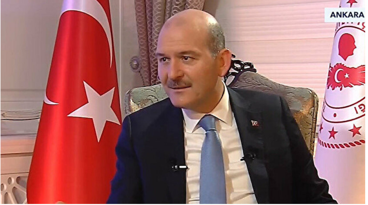
İçişleri Bakanı Süleyman Soylu