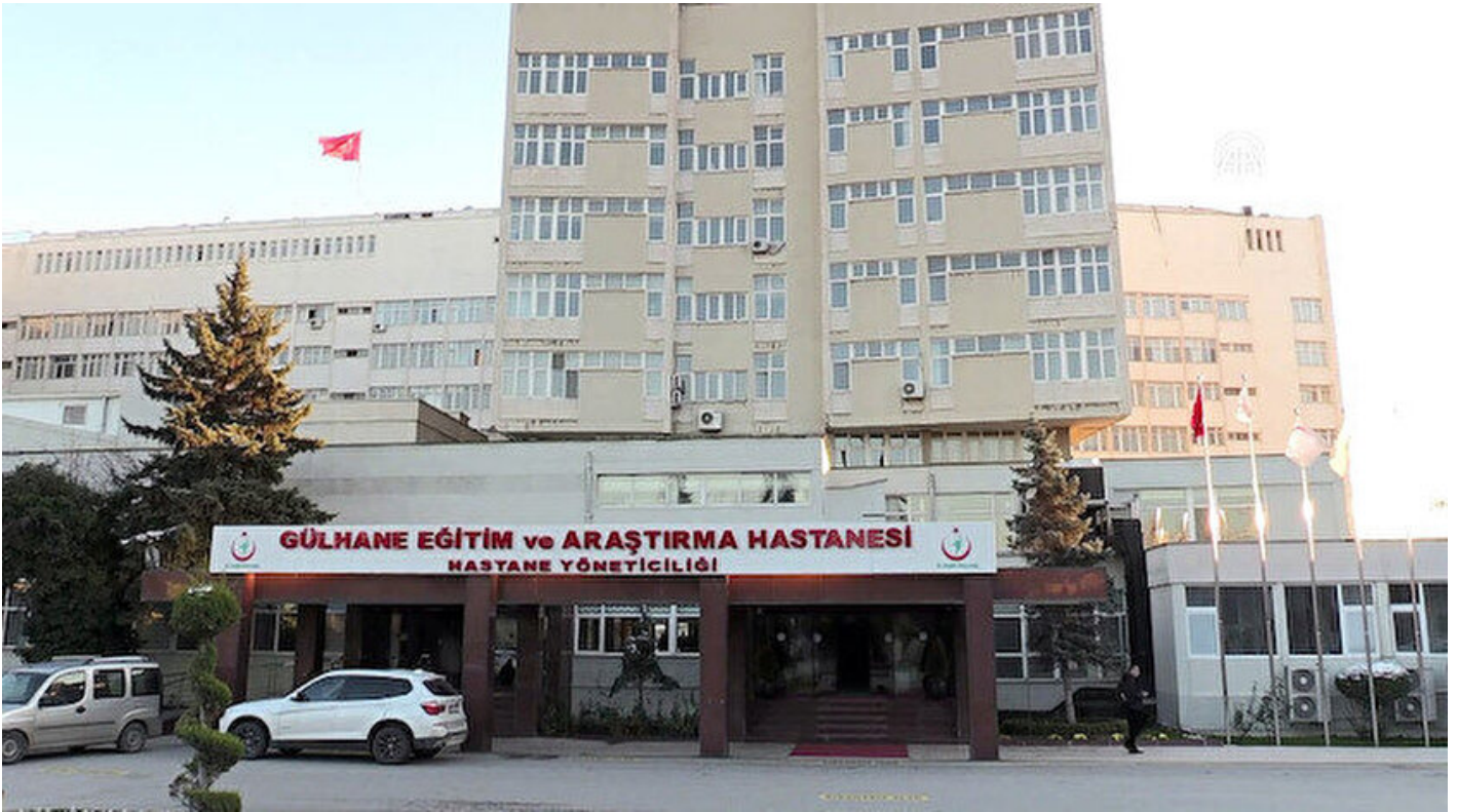
Gülhane Eğitim ve Araştırma Hastanesi

Mustafa Sait Özkan · 26 Aralık 2018, 04:00 · Yeni Şafak