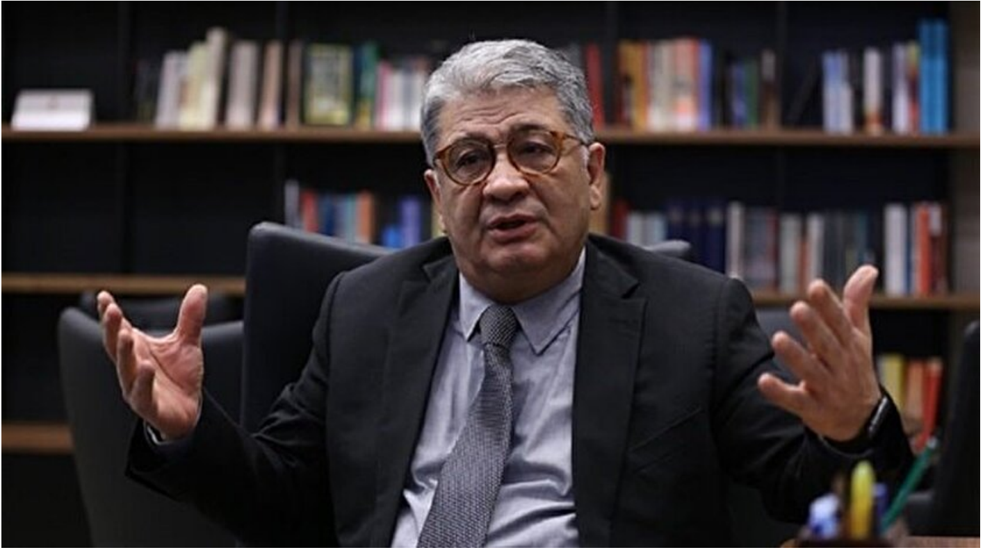
Cumhurbaşkanı Başdanışmanı Cemil Ertem

Haber Merkezi · 26 Eylül 2016, 13:52 · Son Güncelleme: 26 Eylül 2016, 13:59 · AA