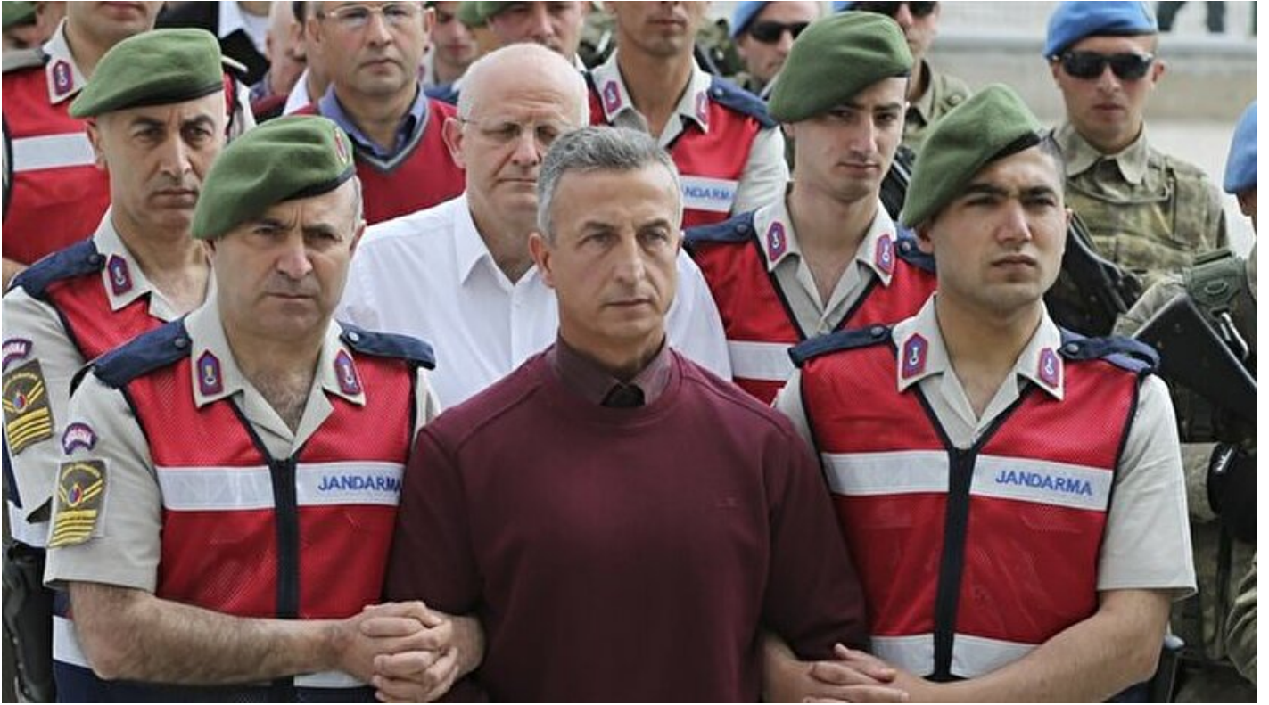
Darbe girişiminde görev alan cuntacı general Erhan Caha

Osman Özgan · 25 Mayıs 2017, 04:00 · Son Güncelleme: 25 Mayıs 2017, 07:14 · Yeni Şafak