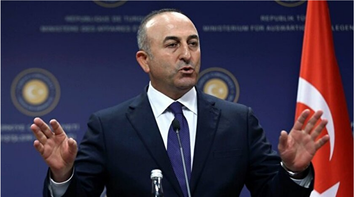
Dışişleri Bakanı Mevlüt Çavuşoğlu

Haber Merkezi · 13 Haziran 2018, 11:39 · Son Güncelleme: 13 Haziran 2018, 11:53 · Diğer