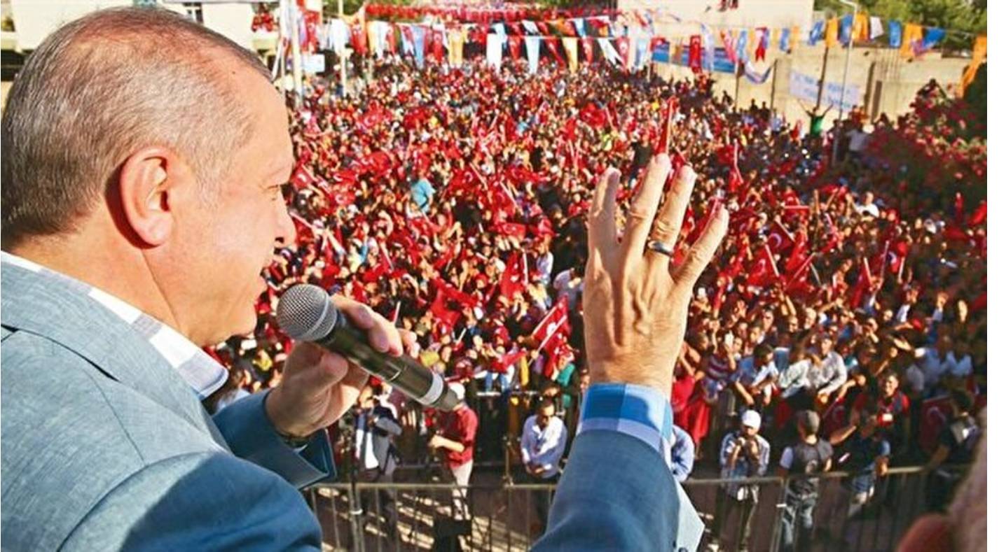
Cumhurbaşkanı Recep Tayyip Erdoğan