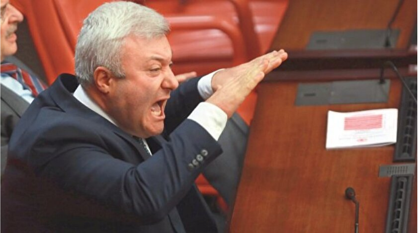
CHP Milletvekili Tuncay Özkan