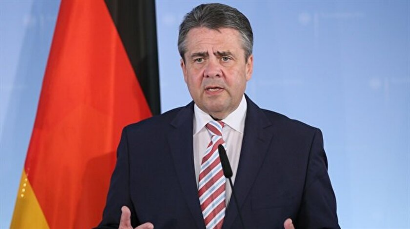
Almanya Dışişleri Bakanı Sigmar Gabriel

Haber Merkezi · 04 Haziran 2017, 12:12 · Son Güncelleme: 04 Haziran 2017, 12:19 · AA