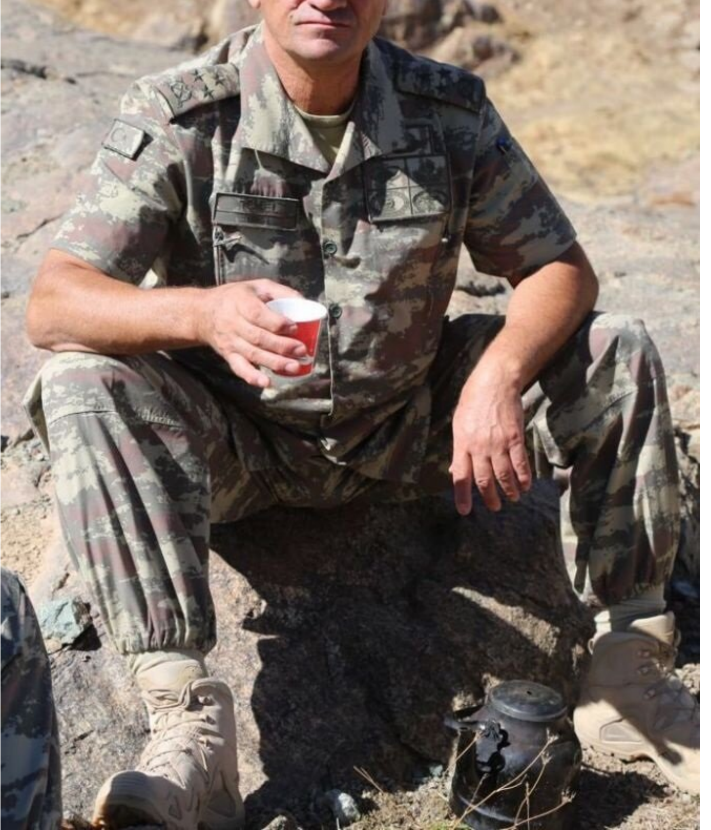
Orgeneral İsmail Metin Temel

Askerleri üzerinde maneviyatı çok üst düzeydir