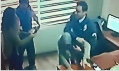
Yardım istedi, darbedilerek dışarıya atıldı