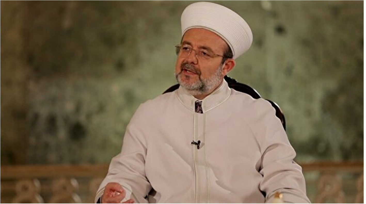
Diyanet İşleri Başkanı Görmez