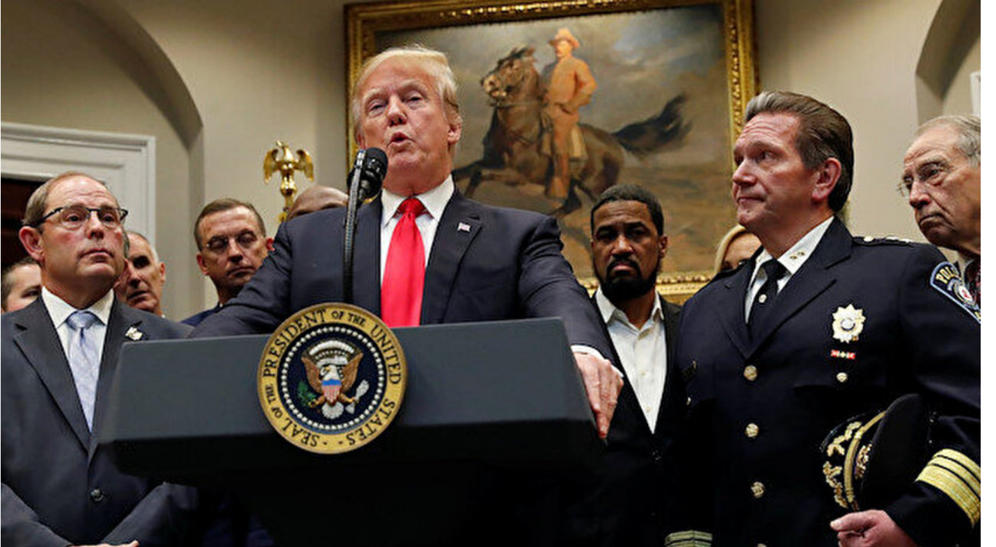
ABD Başkanı Donald Trump

Haber Merkezi • 15 Kasım 2018, 20:06 • Son Güncelleme: 15 Kasım 2018, 21:28 • Diğer