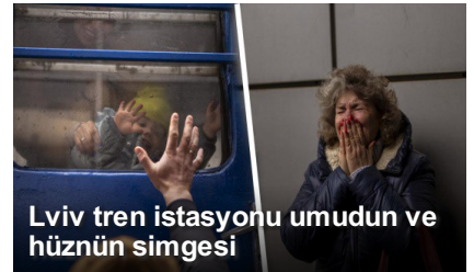
Lviv tren istasyonu umudun ve hüznün simgesi