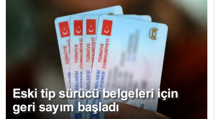
Eski tip src belgeleri iin geri sayım baŐladı