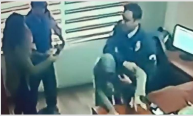
Yardım istedi, darbedilerek dışarıya atıldı