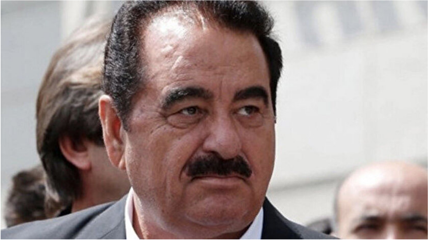
Sanatçı İbrahim Tatlıses.