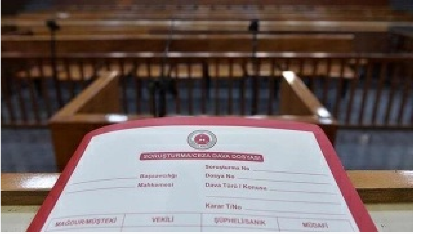
Bekçiyi öldüren sanık hakkında mütalaa açıklandı