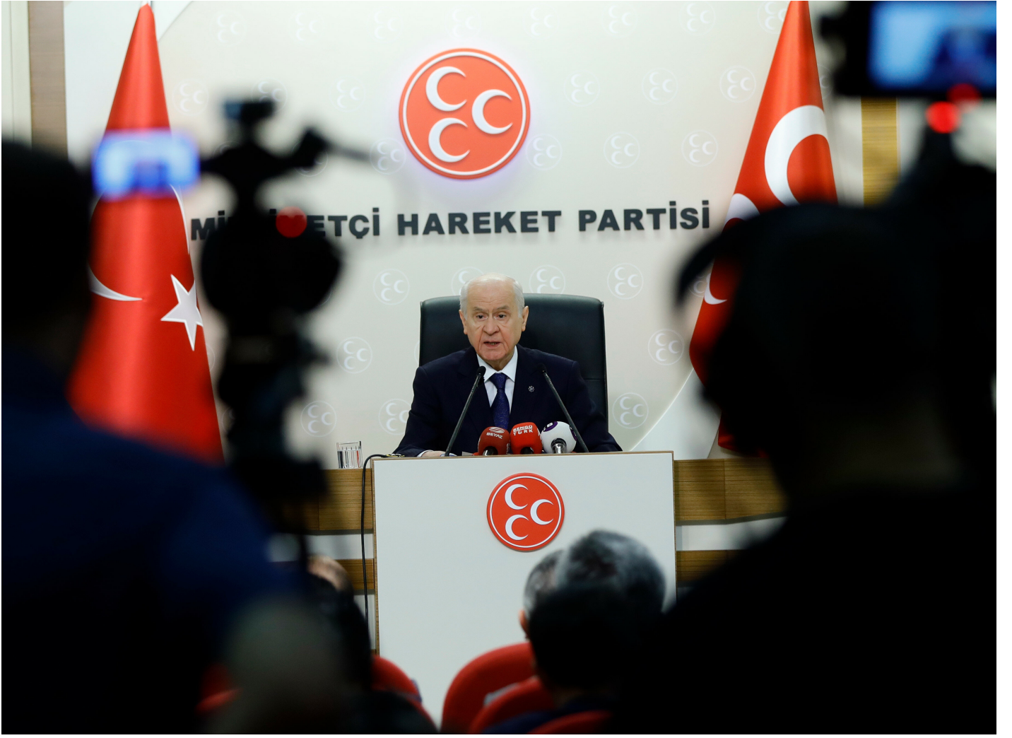
MHP Lideri Bahçeli.

TÜSİAD'ı halk da kabul etmiyor. Alternatifleri de doğmuştur, onlar ilerde ne yapar onu bilemiyorum. TÜSİAD'ın yerine birçok kavramlar üreten, alfabedeki 29 harfi kullanan iş adamları seviyesi de doğmuştur. Ama TÜSİAD bu özelliğini kaybetmiştir, ciddiye alınır tarafı da kalmamıştır. TÜSİAD'ın ilk kurucusu 64 çok değerli bilim, iş hayatının insanları vardır, onlar da artık TÜSİAD'ın içine girmeme eğilimindedir. Şimdi siyasi hayatta hiçbir özellikleri olmayan, iş hayatında da ne yaptıkları belli olmayan insanlardan yapılar oluşuyor.