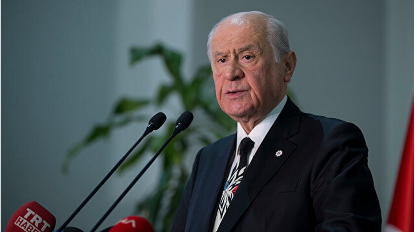
MHP Lideri Devlet Bahçeli.