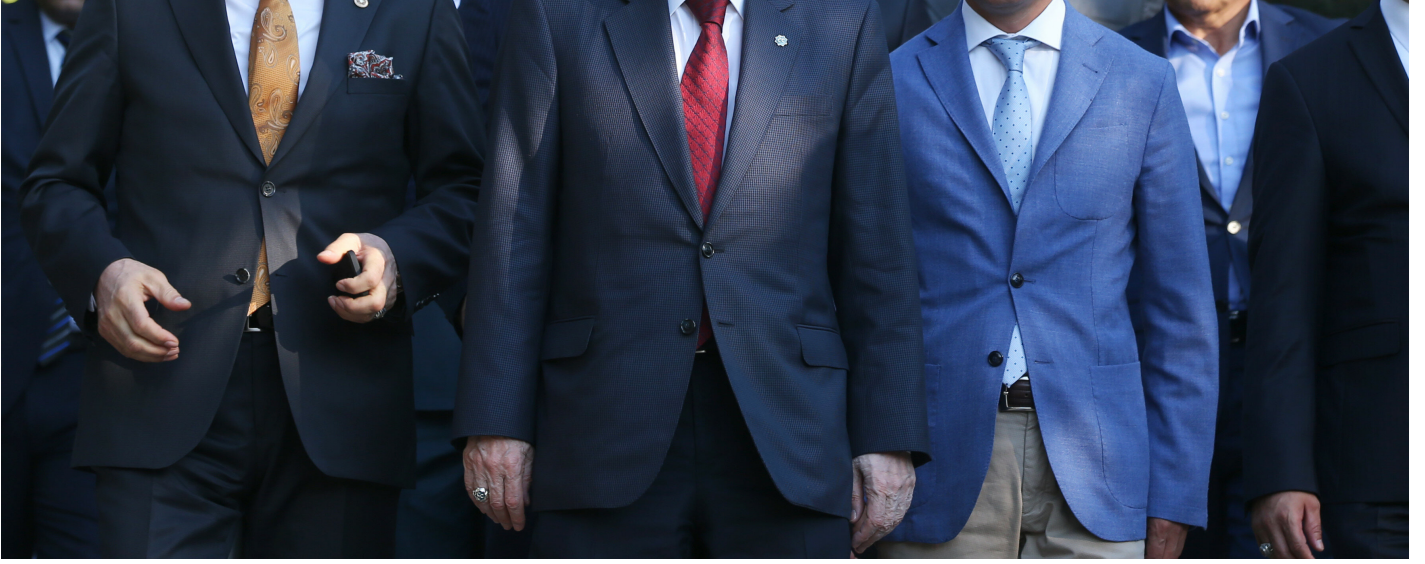
Devlet Bahçeli ve kurmayları.