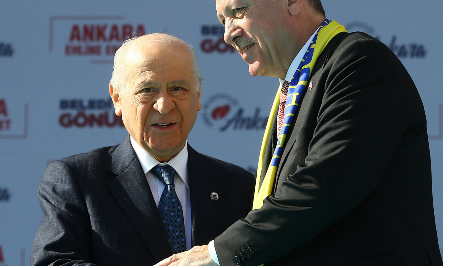
MHP Genel Başkanı Bahçeli ve Cumhurbaşkanı Erdoğan.