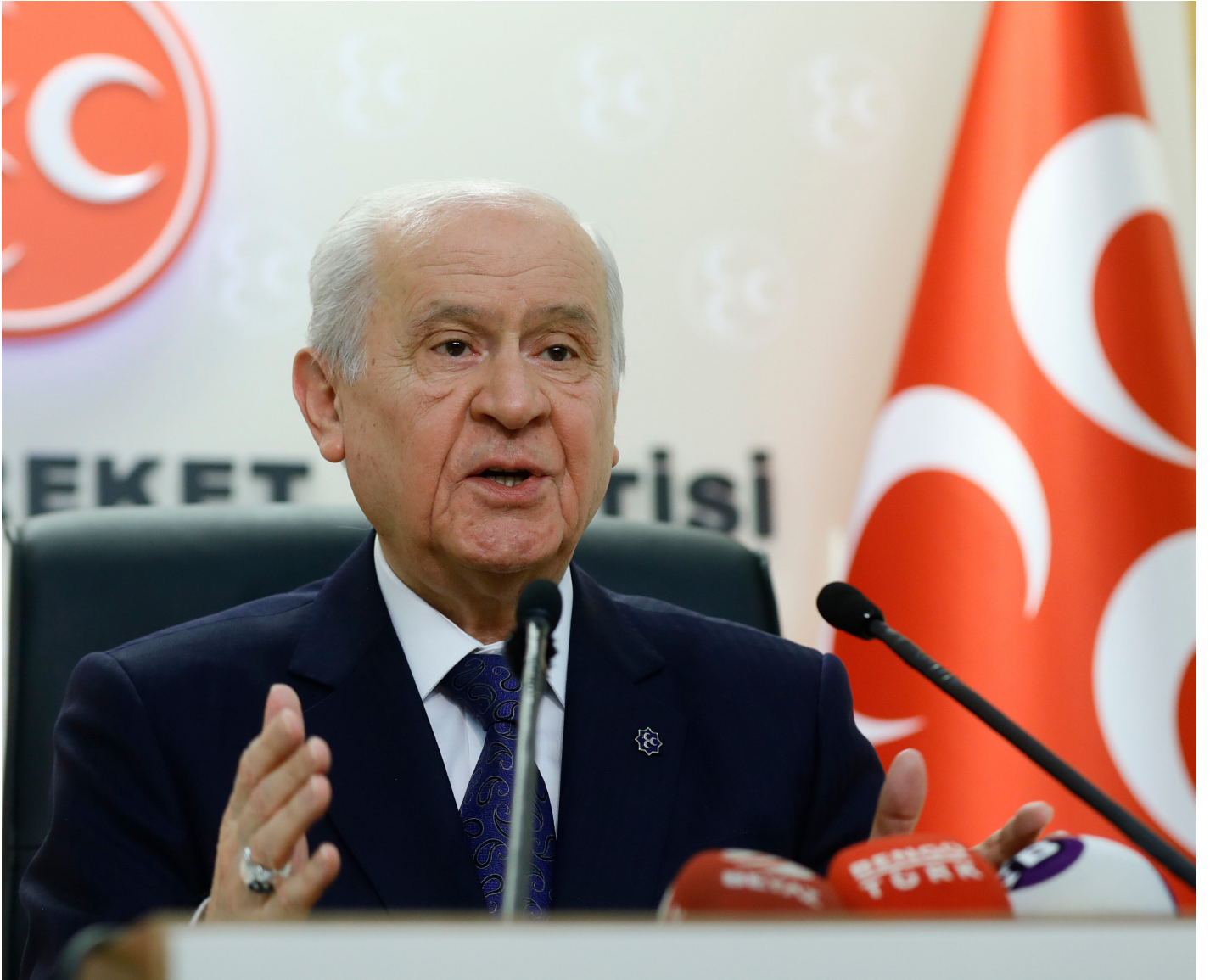
MHP Genel Başkanı Bahçeli.

Hele bazıları var Türkiye'de neredeyse siyaseti ve demokrasiyi kapatacak, seçimleri tamamen lağvedecek. Efendim filan tarihten itibaren seçimler iptal edilmelidir diyor. Bütün bunların hepsinin altı başka anlam taşır. Bir yerlere Türkiye'yi sürüklemenin gereği yok. Seçimler iptal edildikten sonra ne olacak? 24 Haziran'ı iptal ettiniz, 2015'i iptal ettiniz... Geriye doğru giderseniz 1946'ya kadar var! Sonra bunun altından Türkiye nasıl kalkacak, bu siyasiler nasıl kalkacak?