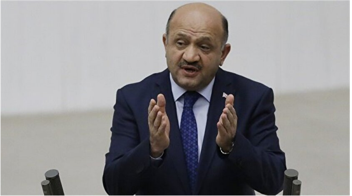
Başbakan Yardımcısı Fikri Işık