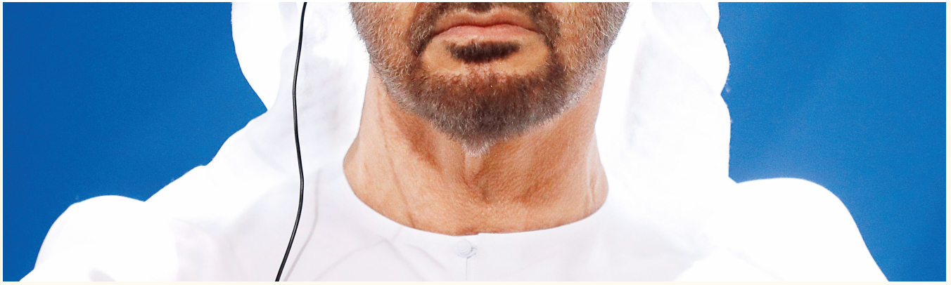
BAE Veliht Prensi Zayed