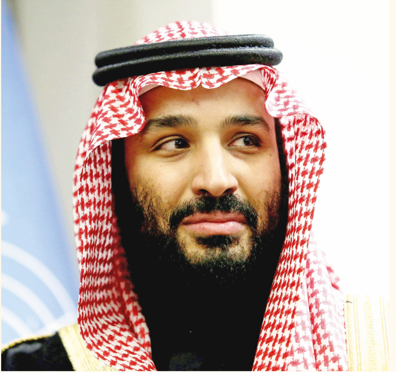
Suud Veliht Prensi Selman

Dabi ve Riyad ın FKK ile temasının hiç olmadiğı kadar ogalığını gosteriyor.