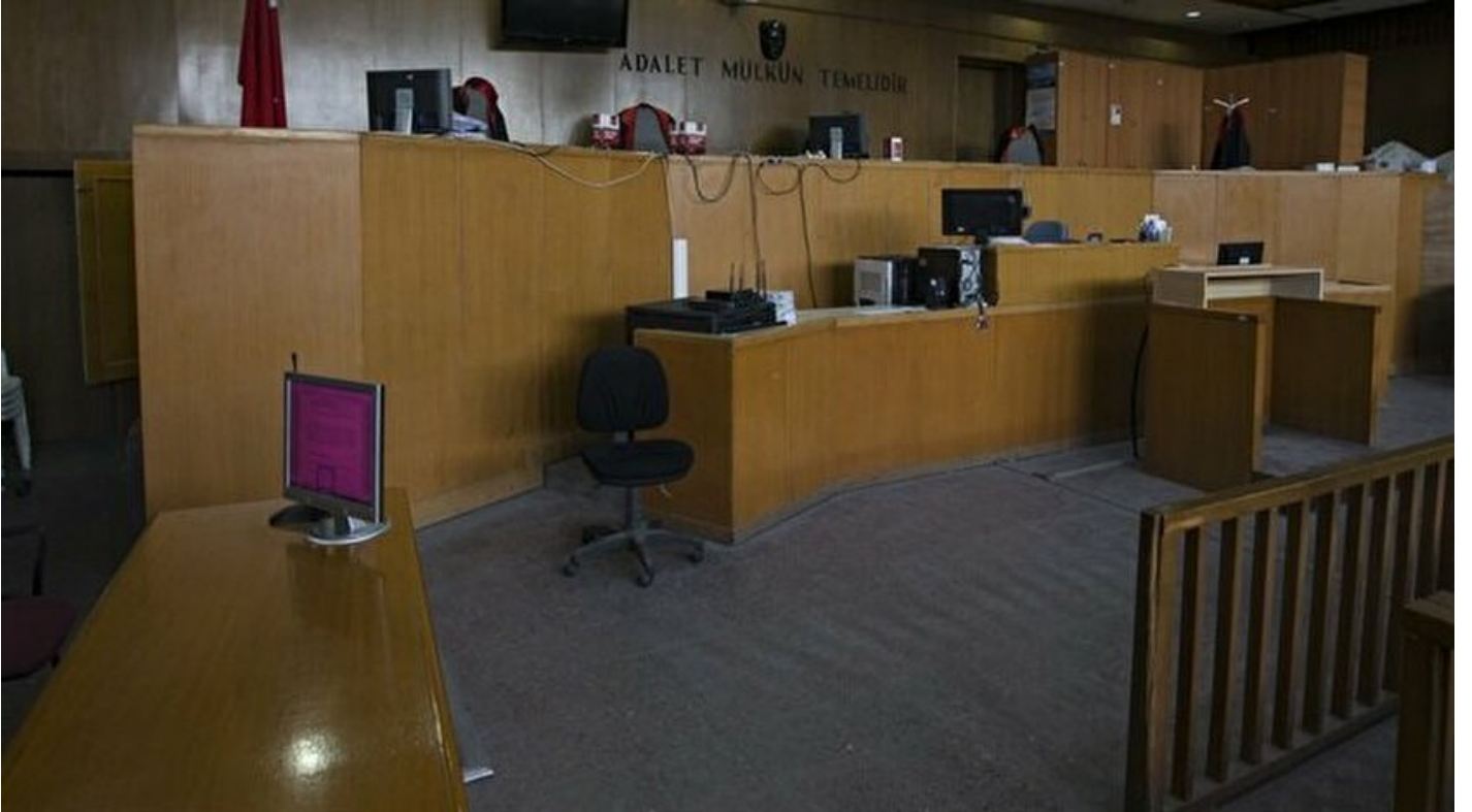
Mahkeme salonu - Arşiv

Haber Merkezi · 27 Mart 2018, 17:17 · Son Güncelleme: 27 Mart 2018, 17:22 · AA