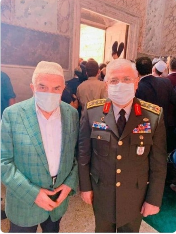
ÖS 3:25 · 26 Tem 2020 · Twitter for iPhone