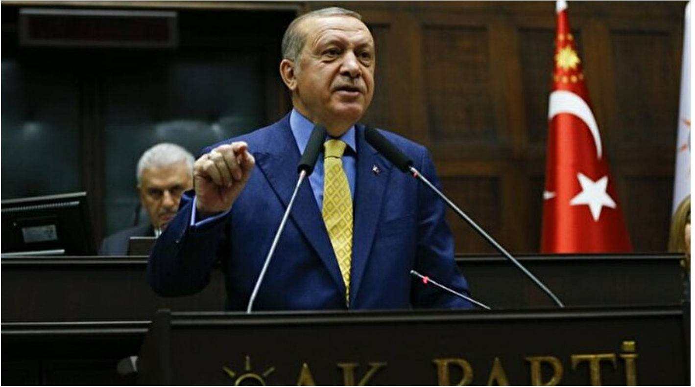
Cumhurbaşkanı ve AK Parti Genel Başkanı Erdoğan