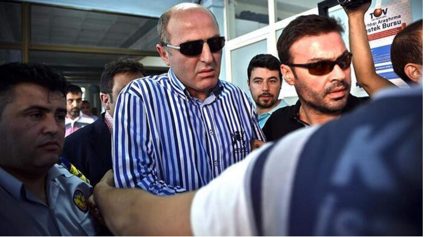
Eski emniyet müdürü Ali Fuat Yılmaz, "resmi belgede sahtecilik" suçundan 7 yıl 6 ay hapis cezasına çarptırıldı.