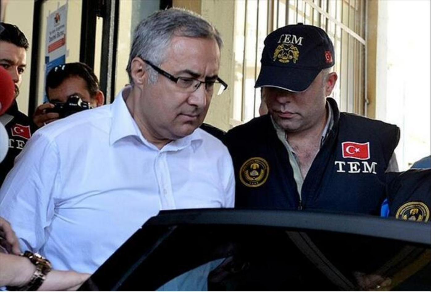
Eski emniyet müdürü Yurt Atayün, "resmi belgede sahtecilik" suçundan 7 yıl 6 ay hapis cezasına çarptırıldı.