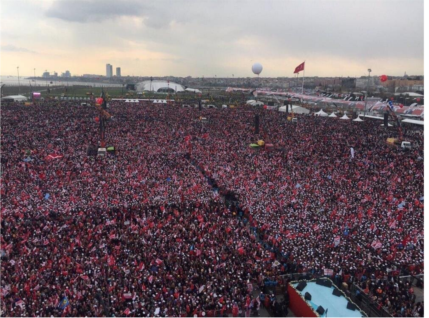
Yenikapı mitinginin havadan çekilmiş fotoğrafı.

Vatandaşların eşlik ettiği Erdoğan konuşmasını, "Yenikapı ruhu işte bu. Yenikapı ruhu asla ölmedi, ölmeyecek. Sadece bu ruha layık olmayanlar gidip kendilerine yakışan safa geçtiler o kadar. Rabbim sizden razı olsun. Hepinize sevgiler saygılar sunuyorum. Kalın sağlıklı. İnşallah 16 Nisan, yeni bir milat olacak. Allah'a emanet olun." diyerek tamamladı.